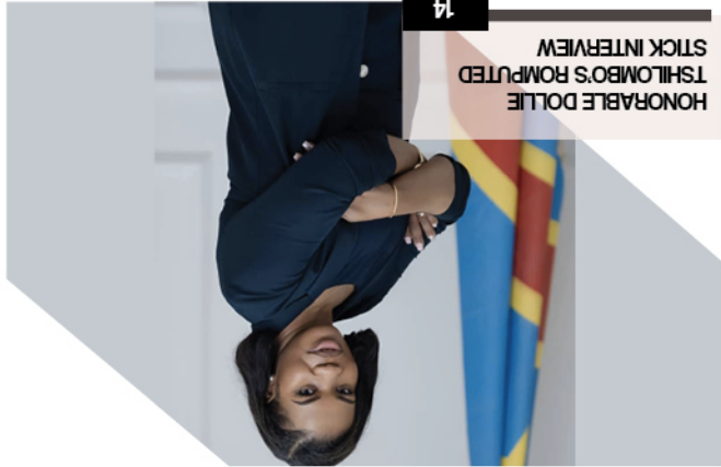
14 HONORABLE DOLLIE TSHILIMBO'S ROMP TED STICK INTERVIEW