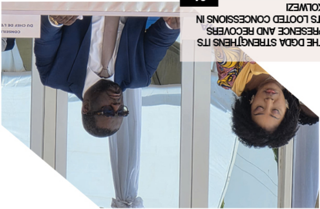
24 THE DGA STRENGTHENS ITS PRESENCE AND RECOVERS IN ITS LOOTED CONCESSIONS IN KOLWEZI

Le Tonnerre magazine for general information, analysis and investigation.