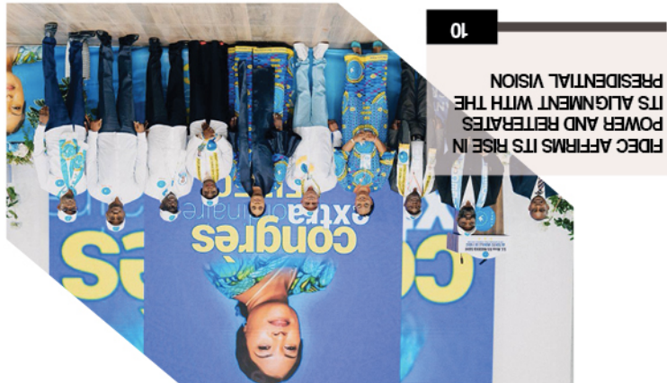
10 FIDEC AFFIRMS ITS RISE IN POWER AND REITERATES ITS ALIGNMENT WITH THE PRESIDENTIAL VISION